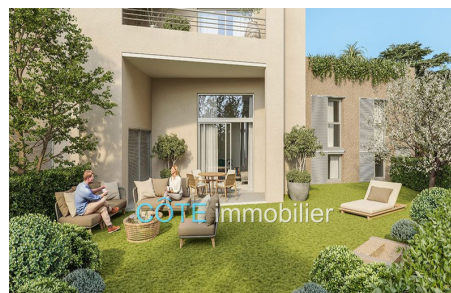
Programme neuf - Convention milancip - MLS Côte d'Azur