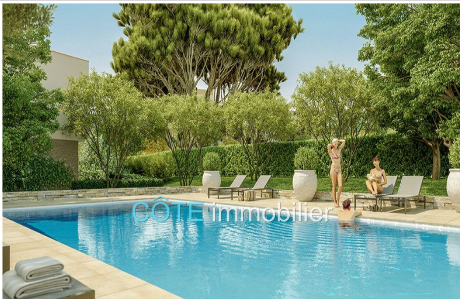
Programme neuf - Convention milancip - MLS Côte d'Azur