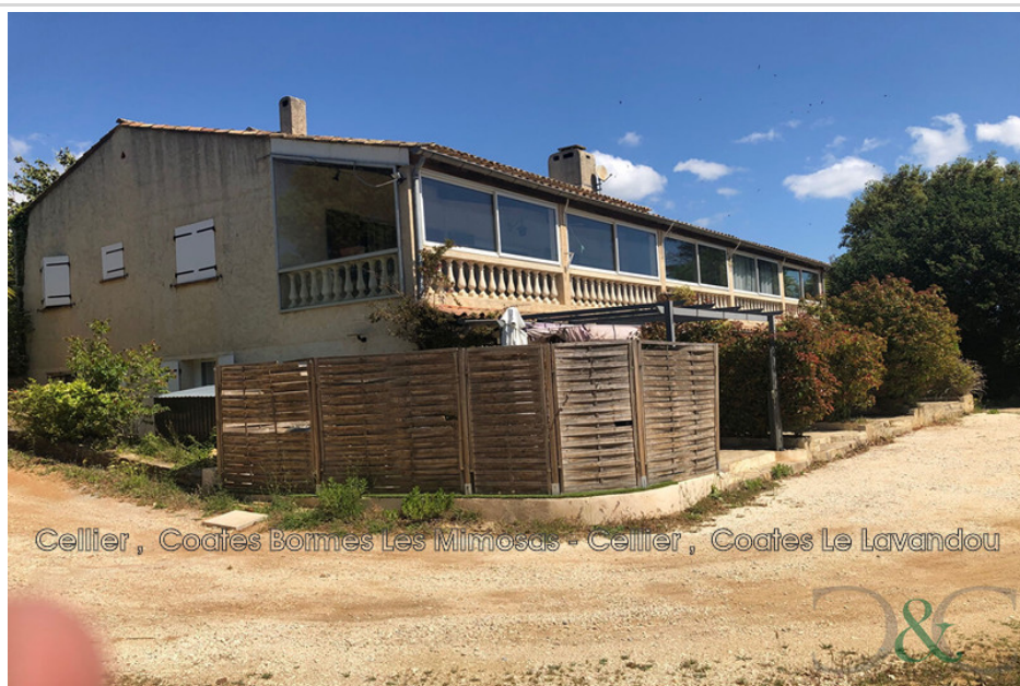
Cellier , Coates Bormes Les Mimosas - Cellier , Coates Le Lavandou